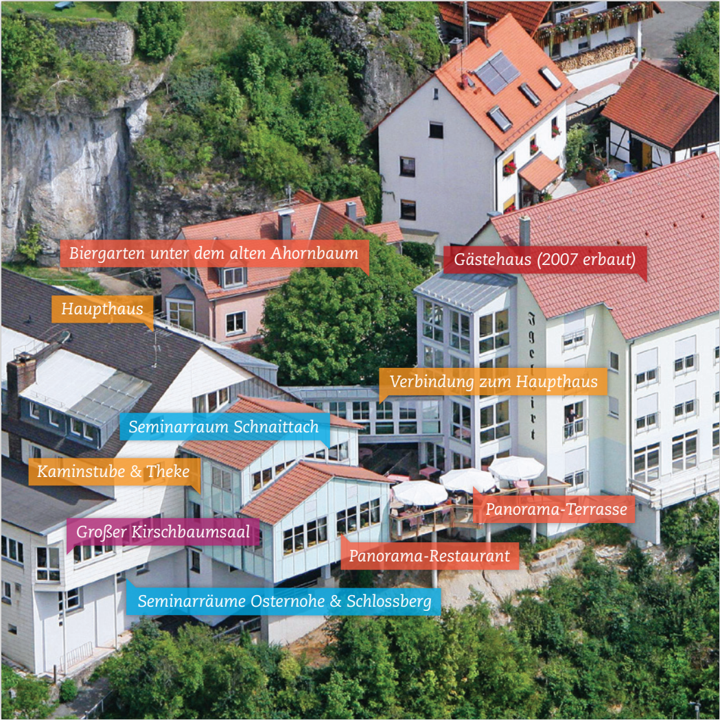
Biergarten unter dem alten Ahornbaum